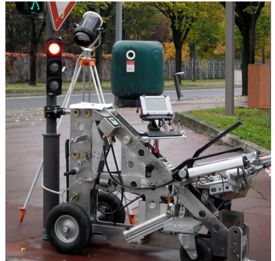
MÉTHODOLOGIE DE CONTRÔLE DITE « STATIQUE AVEC OSCILLATION »

Pour chacune de ces méthodologies, l'opérateur dispose comme moyen de visualisation de deux lasers orientés vers une caméra 3D. Ce dispositif lui permet d'analyser en temps réel les mouvements et le comportement de la structure au 1/1000 mm, et ce dans les 3 axes : avant-arrière, gauche-droite, bas-haut (visualisation tridimensionnelle) et de mesurer la torsion. L'application des efforts s'effectue par paliers maîtrisés ce qui permet l'arrêt immédiat du contrôle au moindre écart du comportement de la structure. Cette précision de visualisation et d'application des efforts caractérise l'approche non destructrice des méthodologies proposées.