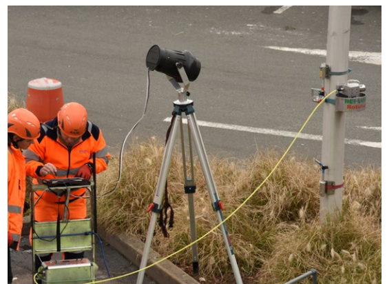
MÉTHODOLOGIE DE CONTRÔLE DITE « DYNAMIQUE »